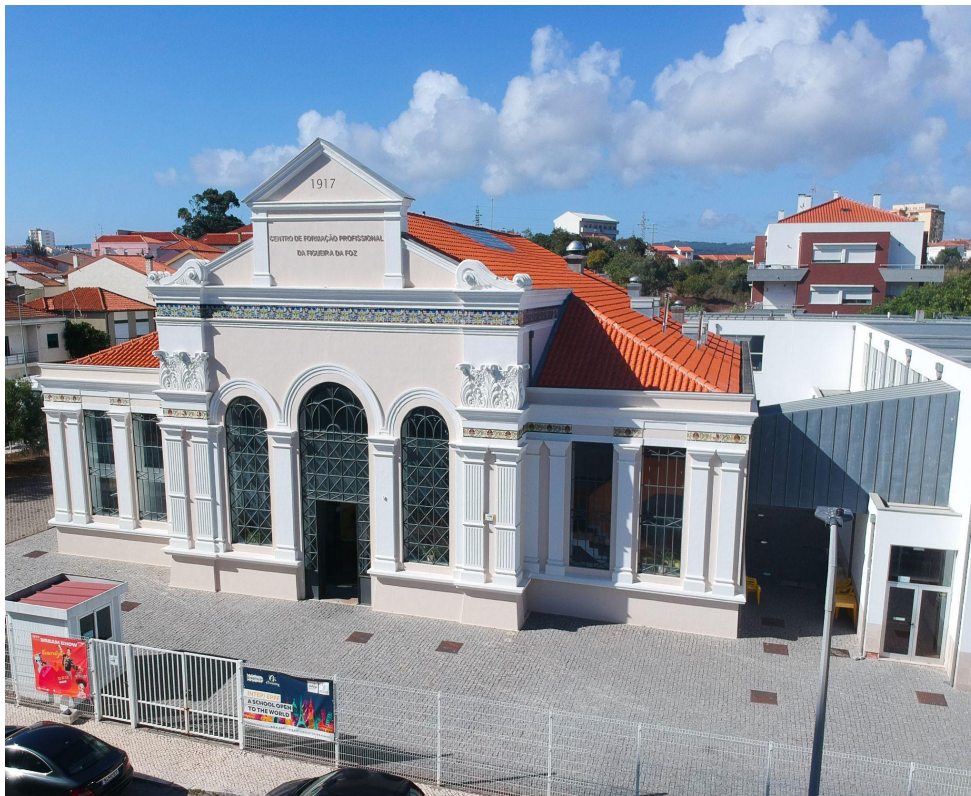
(INTEP, Figueira da Foz)

A qualidade da formação ministrada no Instituto Tecnológico e Profissional da Figueira da Foz (INTEP) exige uma maior abertura e permanente interação com o meio envolvente, conseguidas, essencialmente, através do estabelecimento de parcerias e protocolos, bem como do diálogo permanente com o tecido económico e social da região.